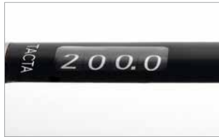
即使在移液器倾斜时也能轻松读取容量。

方便阅读的大尺寸显示屏有助于您远距离识别所设定容量的全部四位数字，防止眼睛疲劳。即使在移液器倾斜时也能轻松读取容量—无需将头扭转到不舒服的位置。